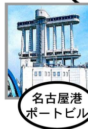
名古屋港ポートビル